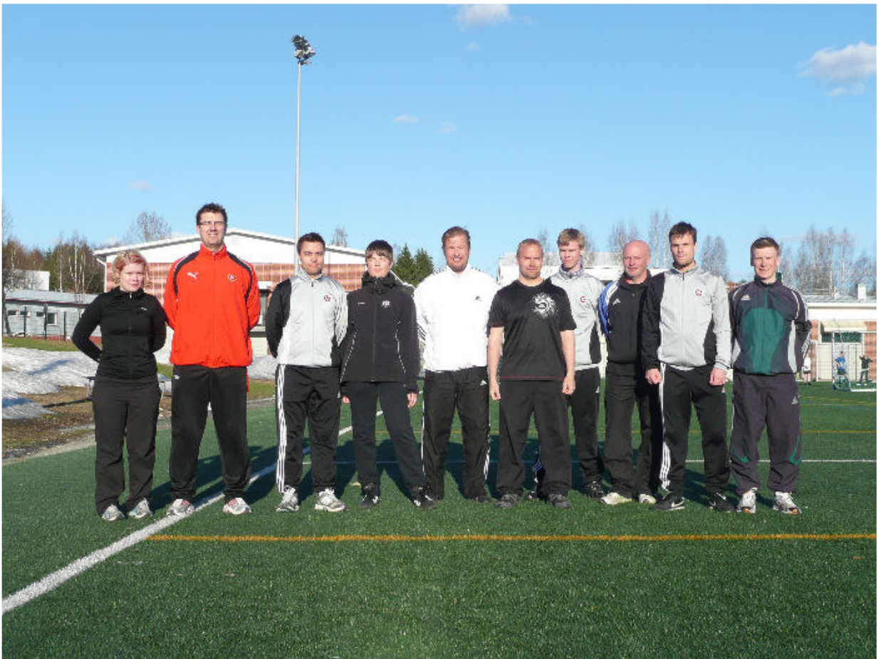
Kenttäkoulutus Palokassa 29.4.2011. Osallistujia olisi saanut olla enemmänkin.